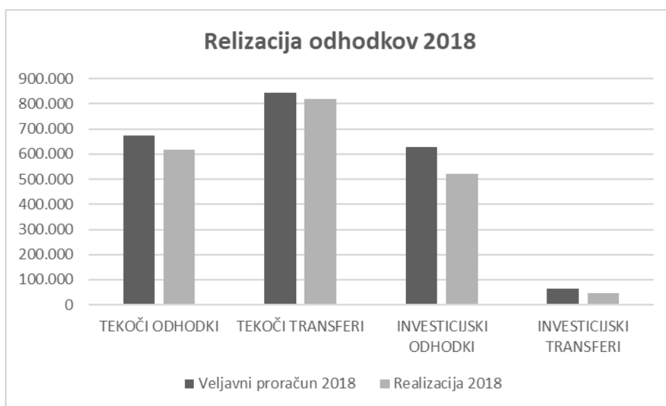
Graf 2: Realizacija odhodkov glede na veljavni proračun leta 2018