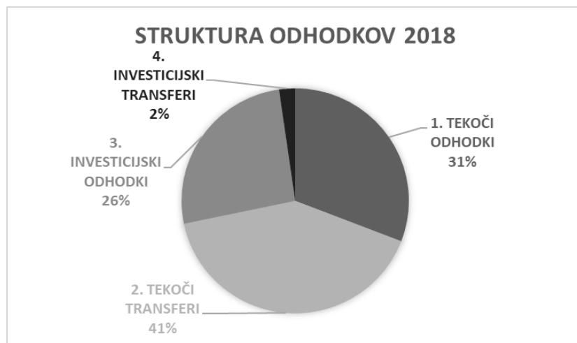
Graf 3: Struktura posameznih vrst odhodkov leta 2018 v celotnih realiziranih odhodkih

Odhodki so bili realizirani v višini 2.005.189 EUR, kar je za 9,2 % manj kot je bilo planirano, najnižja je bila realizacija pri investicijskih transferih. V strukturi vseh odhodkov predstavljajo najvišji delež, in sicer 40,88 % vseh odhodkov, tekoči transferi. Sledijo jim tekoči odhodki in investicijski odhodki. Najnižji odstotek predstavljajo investicijski transferi.